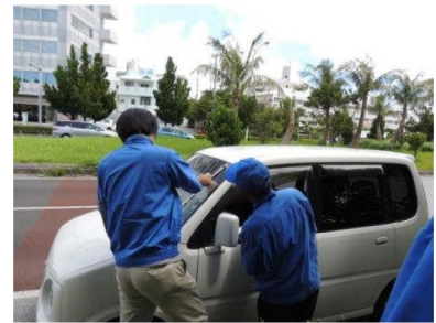
<街頭検査実施状況>