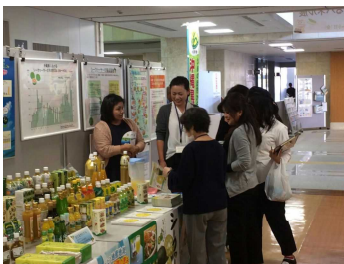
(農産物加工食品の展示・試食)