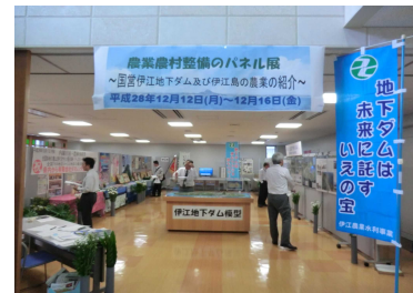
(農業農村整備のパネル展)