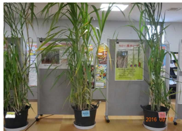
(さとうきび奨励品種の展示)