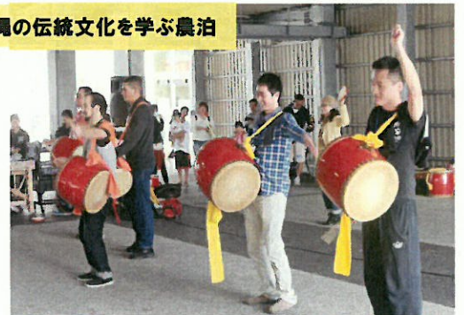
沖縄の伝統文化を学ぶ農泊