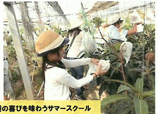
収穫の喜びを味わうサマースクール