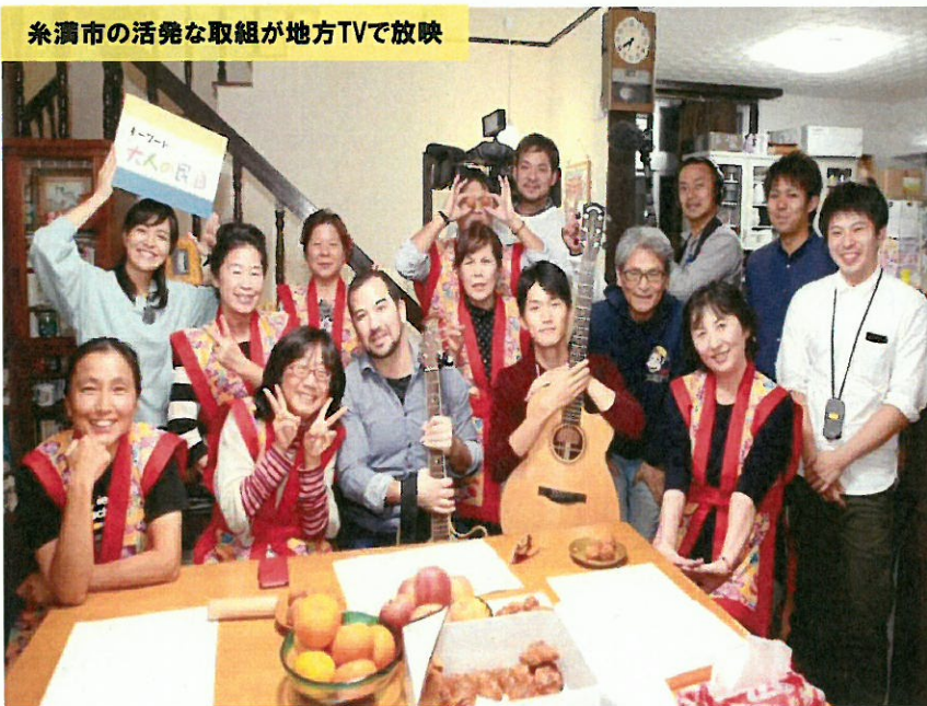
糸満市の活発な取組が地方TVで放映