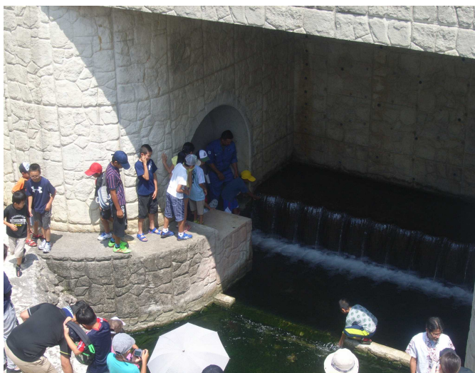
慶座地下ダム見学の様子