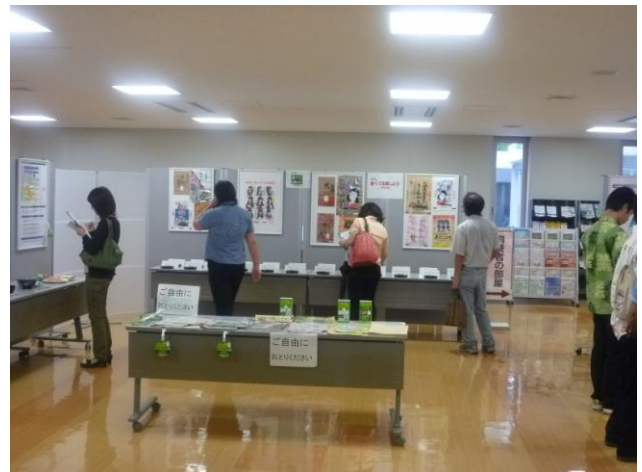
クイズにも答えていただきました。