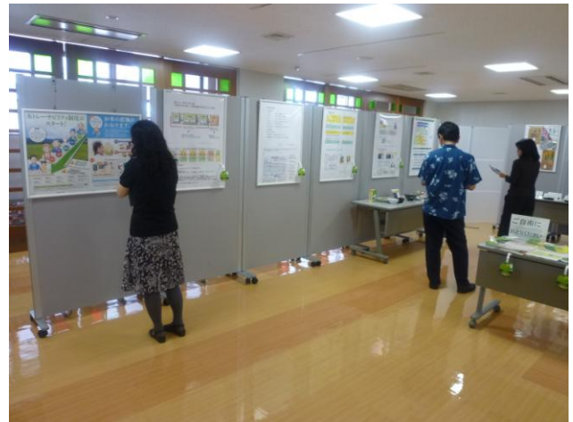
パネル展示等の様子（米トレーサビリティ法）