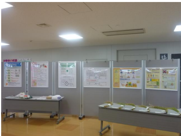
パネル展示等の様子（JAS法）