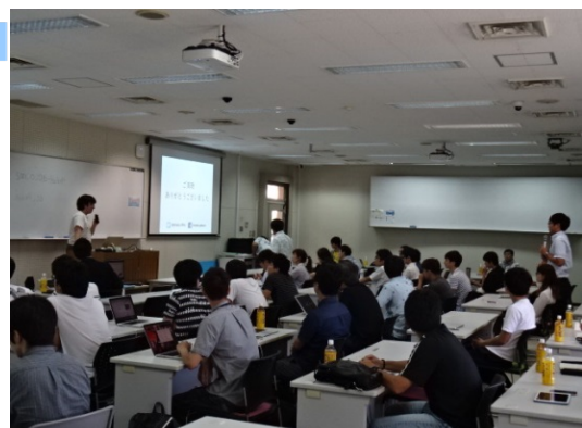
10月1日開催キックオフセミナー風景

※「セキュリティ・ミニキャンプ in 沖縄 2016」開催後の振り返り及び関係者ネットワークの構築