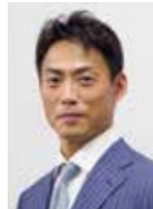
桧山進次郎氏 プロ野球解説者

1974年奈良県生まれ。祖父は柔道場「豊徳館」館長。父は天理高校柔道部元監督という柔道一家に育つ。アトランタ、シドニー、アテネ五輪で柔道史上初、また全競技を通じてアジア人初となる五輪3連覇を達成する。その後、たび重なる怪我と闘いながらも、さらなる高みを目指して現役を続行。2015年8月29日、全日本実業柔道個人選手権大会を最後に、40歳で現役を引退。