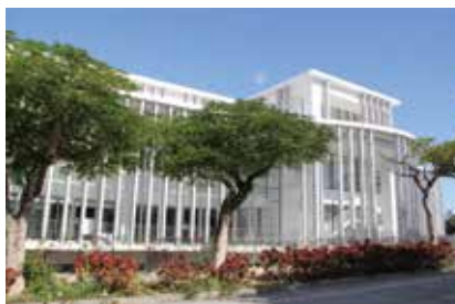
うるま市役所(本庁)