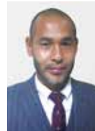
高原直泰氏 沖縄SV株式会社 代表取締役

1969年京都府生まれ。東洋大学を卒業後、1991年のプロ野球ドラフトで、阪神に入団。2005年までレギュラー。2006年からは主に代打で活躍し「代打の神様」と呼ばれるほど人気を博した。現役時代には月間MVP、日本シリーズ優秀選手賞、フレッシュオールスターゲームMVP、若林忠志賞など多数受賞。2013年の引退後、野球解説者・評論家として活躍中。