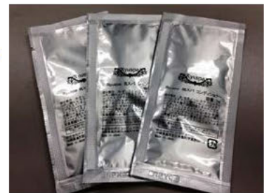
【仕上がりサンプル】