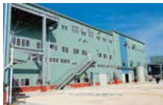
▲完成した製糖工場

今回、新工場の整備により、これまでの課題であった工場操業の効率化に加え、徹底した衛生管理による品質の高い黒糖の安定供給が可能となることから、さとうきび及び黒糖生産の更なる振興が図られることが期待されています。