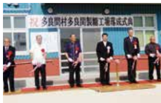
▲伊良皆村長(写真中央)ら関係者によるテープカット