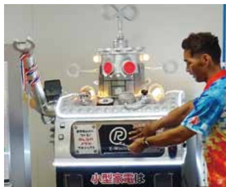
▲譜久里氏による投函の様子

同メダルプロジェクトは、県内16市町村及び29郵便局において、携帯電話等の回収を2019年3月迄実施していますので最寄りの自治体・郵便局にお問い合わせください。