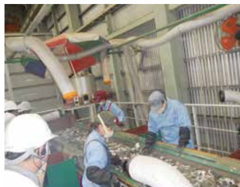
▲リサイクルプラント見学の様子

初日10月10日(水)午後、沖縄管内で家電リサイクル(指定引取場所)、自動車リサイ