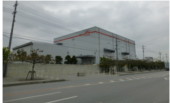
▼マリnpark内の工業団地（2）