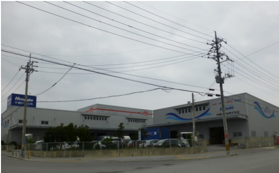
▼マリnpark内の工業団地（1）